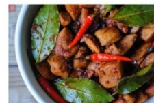
AJAM KETJAP PEDIS