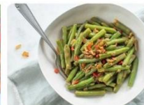
Zelfgemaakte boontjes sajoer